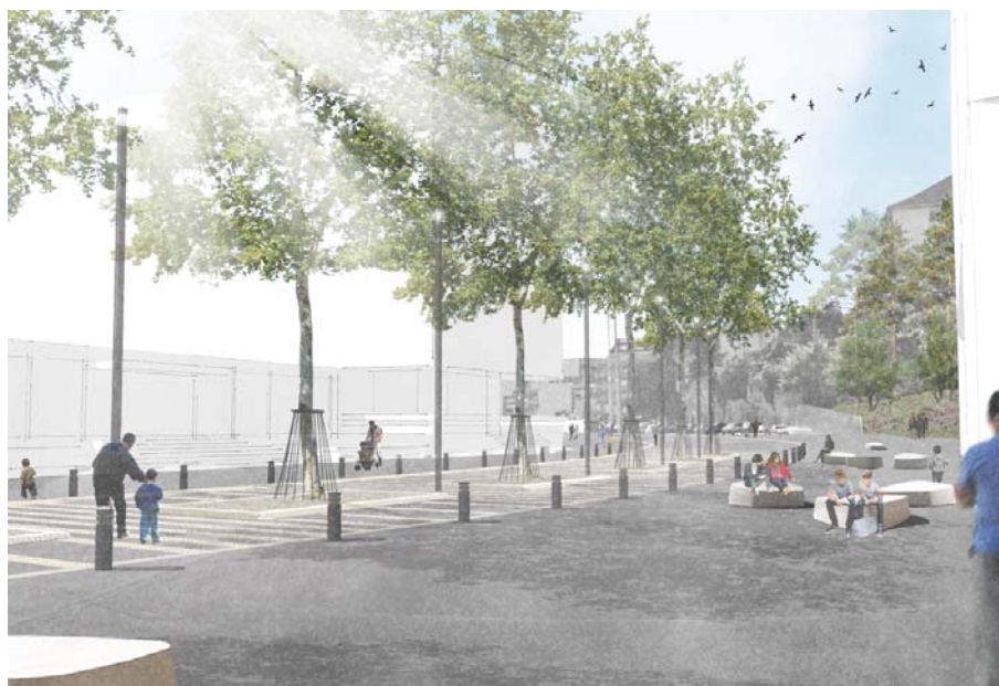
Visualisation 3D de la rue de la Maladière: Hüsler

Les autorités ont étroitement associé les habitants et les représentants des associations de quartier au projet. Ce processus a eu lieu lors de l'élaboration du plan de quartier. Le réaménagement comprend la mise en place d'une zone à 30 km/h, y compris le long de la rue de la Maladière, empruntée par les transports publics.