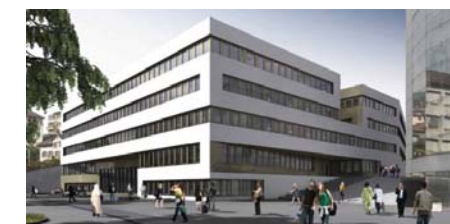
Visualisation du bâtiment Microcity: Erne + Bauart