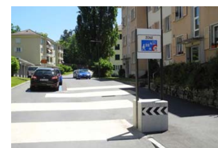
Zone de rencontre rue Marie-de-Nemours

Aménagement: Ville de Neuchâtel, service de l'Aménagement urbain; Hüsler et Associés, architectes paysagistes, Lausanne