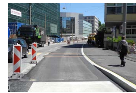
Travaux rue de la Maladière