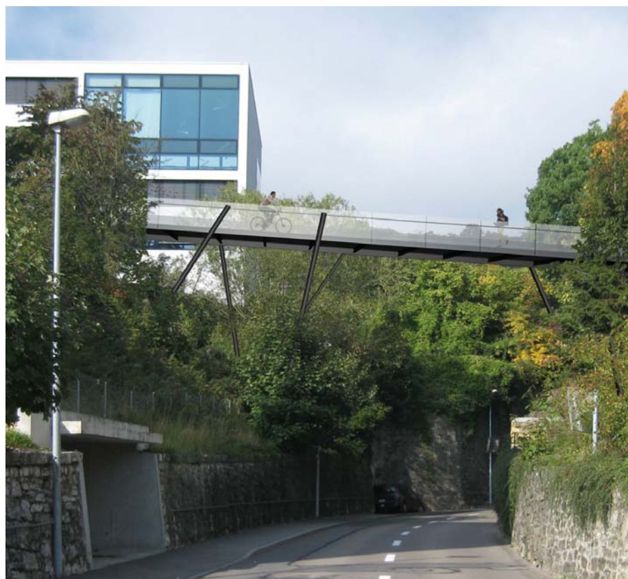
Photomontage de la passerelle du Millénaire: Bauart

La passerelle du Millénaire est construite pour les piétons et les cyclistes; elle permettra de relier la gare CFF de Neuchâtel et l'espace de l'Europe à la colline de Bel-Air.