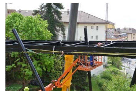
Montage de la passerelle