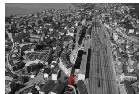
Quartier Ecoparc: Bauart

Ingénieur civil: GVH St-Blaise SA, Saint-Blaise